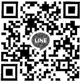
QR Code Group