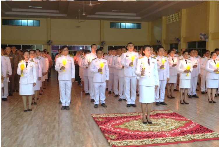
พิธีบำเพ็ญกุศลและพิธีน้อมรำลึกเนื่องในวันคล้าย สวรรคตพระบาทสมเด็จพระจุลจอมเกล้าเจ้าอยู่หัว ในวันพุธ ที่ ๒๓ ตุลาคม ๒๕๖๒ ณ หอประชุมอำเภอเขาชะมา