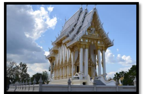
วัดศรีประชาธรรม