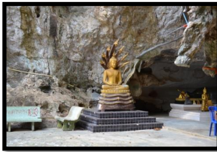
สำนักสงฆ์ถ้ำเนรมิต