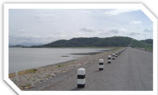
อ่างเก็บน้ำประแสร์