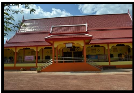
วัดชำฆ้อสามัคคีธรรม